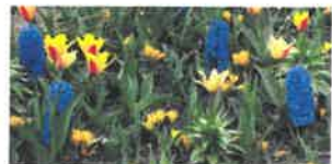
Crocus et Jacinthe