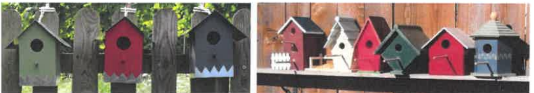
Les nichoirs décorent avantageusement le jardin

Les boules du commerce doivent être sortie du filet qui les enveloppe